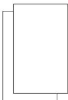
Sicherheitshinweise und Anleitung