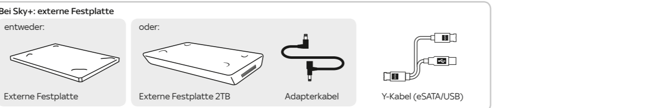
Bei Sky+: externe Festplatte, Externe Festplatte, Externe Festplatte 2TB, Adapterkabel, Y-Kabel (eSATA/USB)

Verwenden Sie nur das mitgelieferte Originalzubehör, um Funktionsstörungen zu vermeiden. Falls Sie Ihren Receiver aufgrund eines Wechsels der Empfangsart getauscht haben, nutzen Sie bitte das Zubehör Ihres bisherigen Sky Receivers.